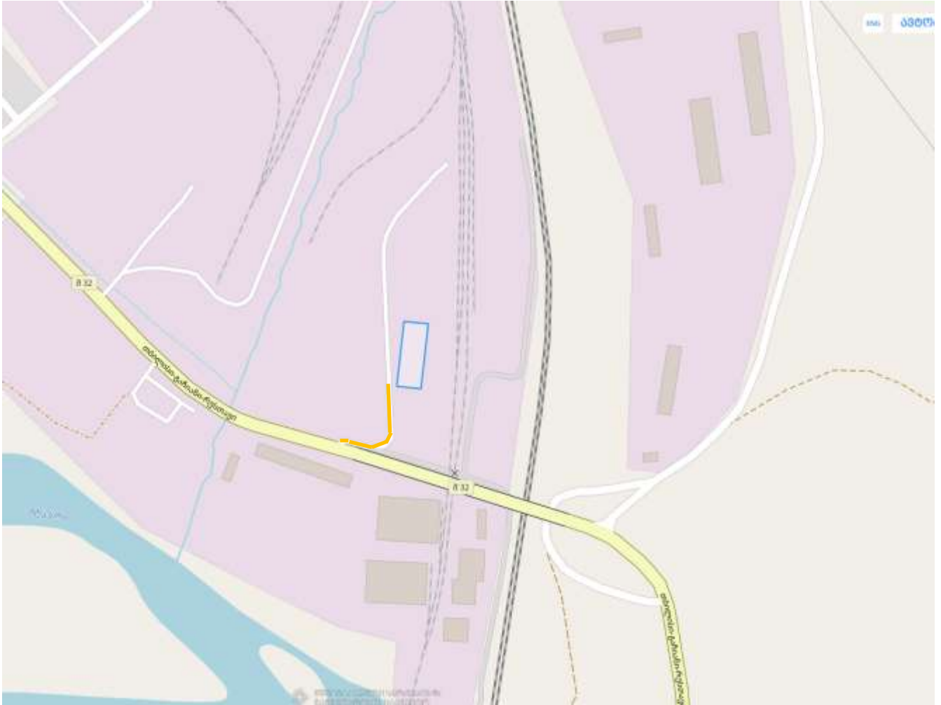
სურათი 6.9.1. სატრანსპორტო ნაკადის მოძრაობის სქემა.