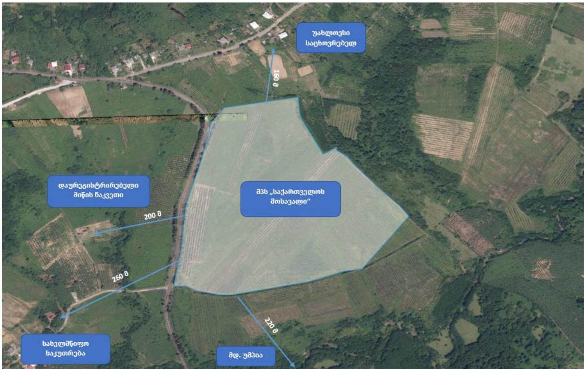
სურ. N 2 - ობიექტის განთავსების სიტუაციური რუკა