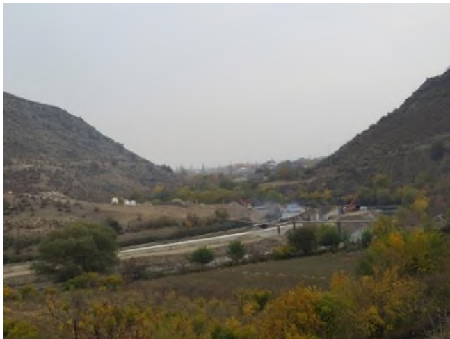
სარწყავი სისტემების ხედები