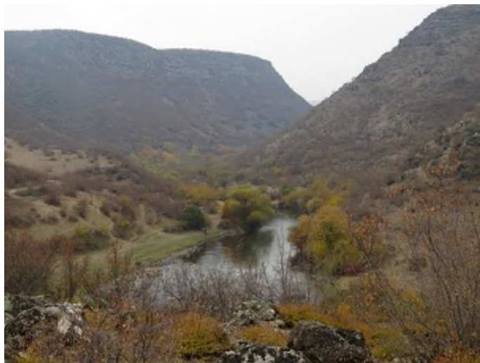
მდინარე ხრამის ერთ-ერთი ხედი