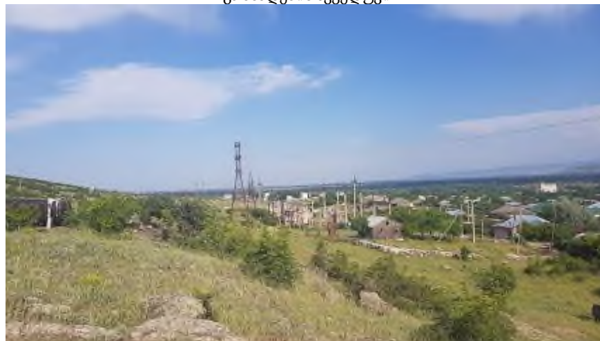
ქს „ქოლაგირი 110“