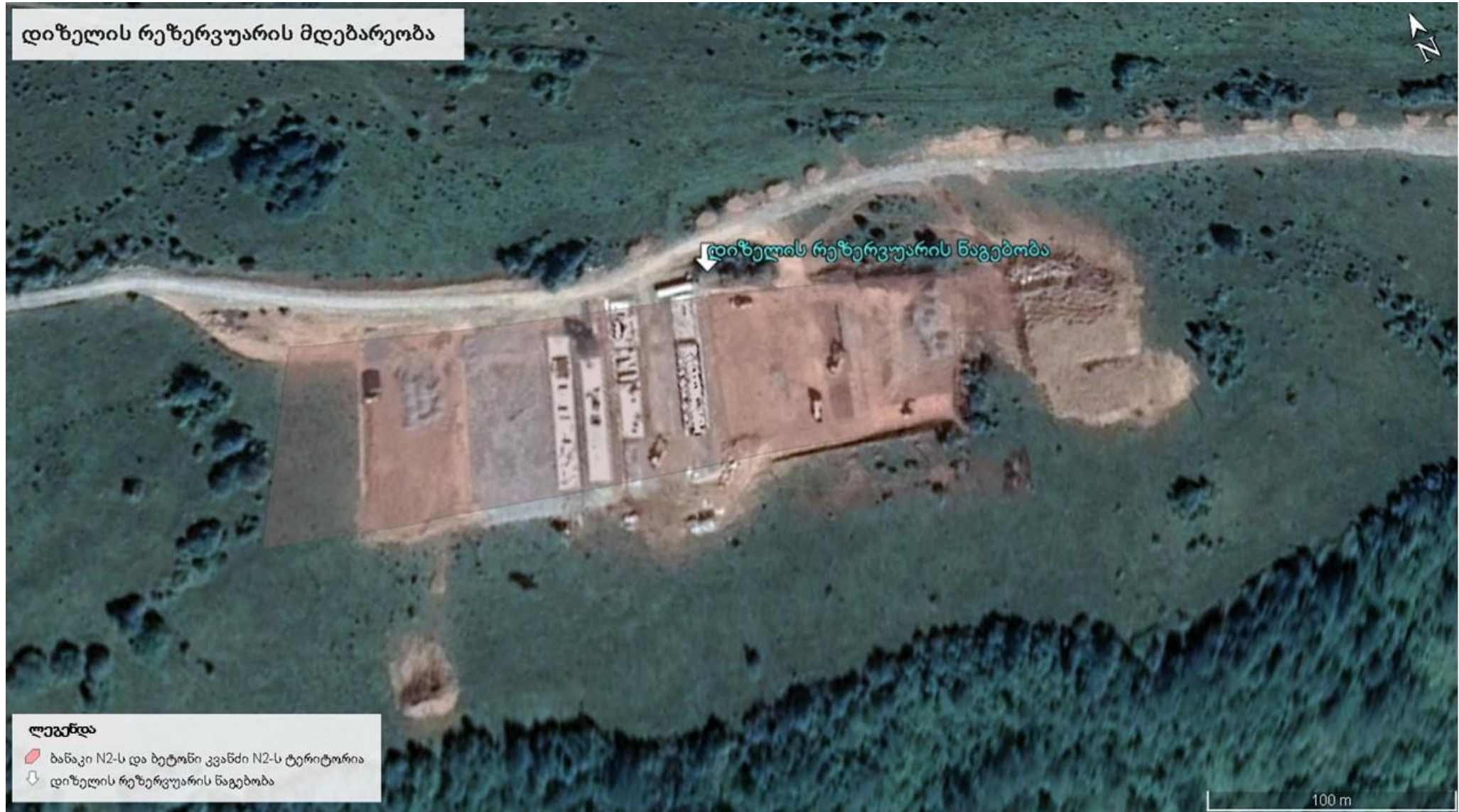
ნახაზი 2.1. საპროექტო ტერიტორიის სიტუაციური სქემა