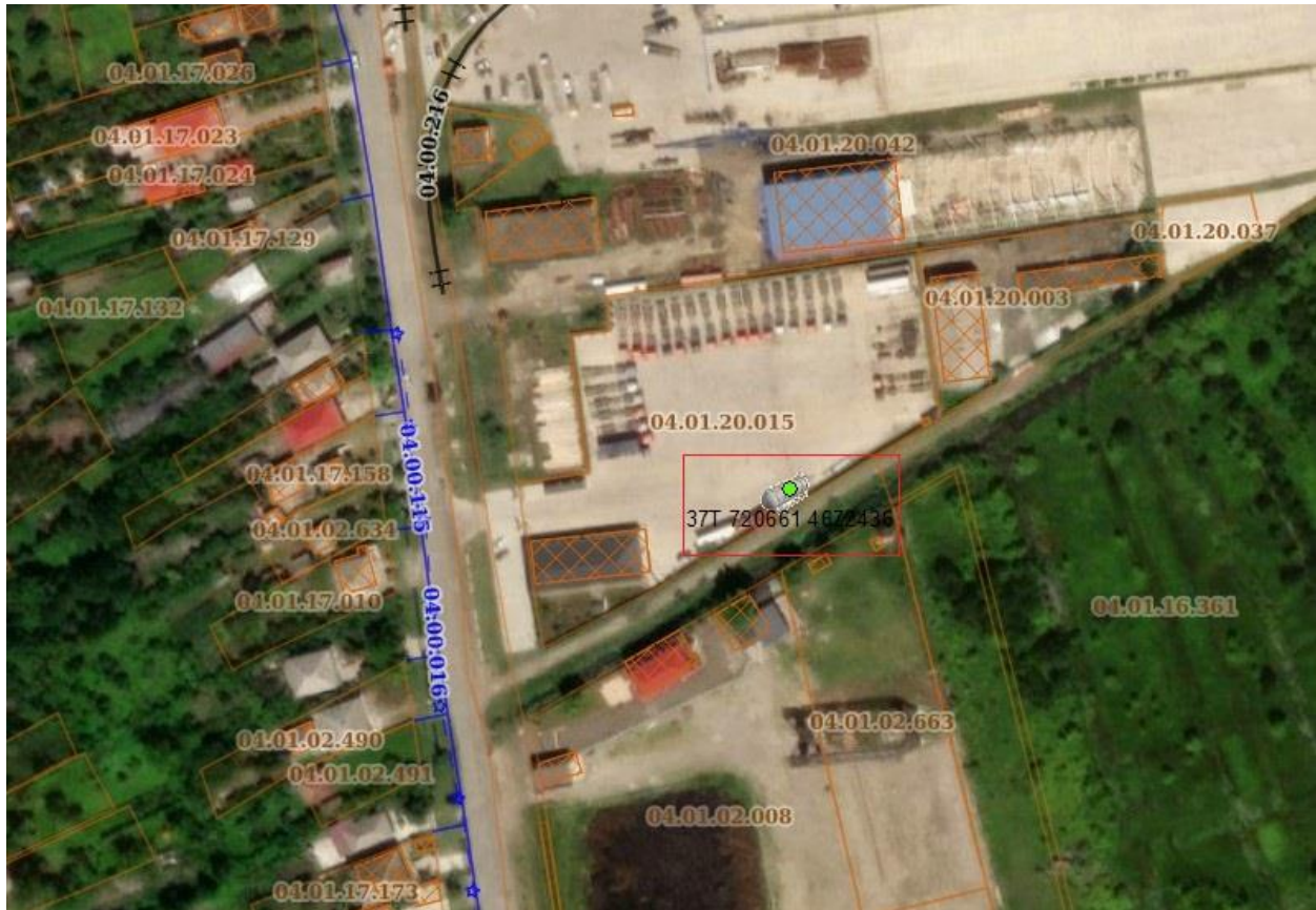
რუკა N1 - ნავთობპროდუქტების საცავის განთავსების ადგილი

სასაწყობე ტერიტორიის გარშემო წარმოდგენილია სხვადასხვა ფუნქციური დატვირთვის, მათ შორის ძირითადად შპს „ტრანს-ალიანს ფოთის“ ეკონომიკური საქმიანობის ანალოგიური ობიექტები (სასაწყობე მეურნეობები). ნავთობპროდუქტების საცავისთვის გათვალისწინებული ადგილი მდებარეობს ნაკვეთის სამხრეთ ნაწილში, შემდეგ GPS კოორდინატებზე: 37T X-720661, Y-4672436 (იხ. რუკა N1). ობიექტის განთავსების ადგილიდან უახლოესი დასახლება წარმოდგენილია დაახლოებით 130 მეტრის დაშორებით (ქალაქი ფოთი, ფალიაშვილის ქუჩა).