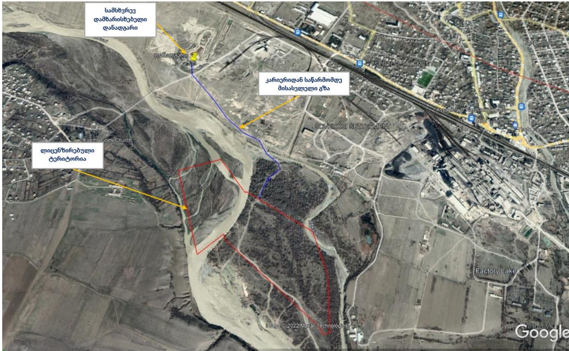
სურ. N 5.2 - ლიცენზირებული ობიექტიდან სამსხვრევ დამხარისხებელ დანადგარამდე მისასვლელი გზა