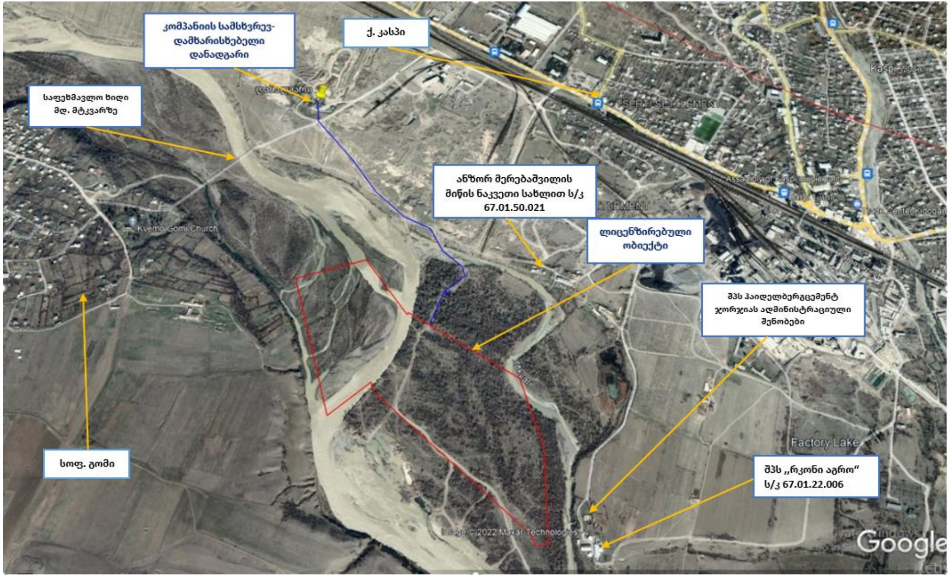
სურ. N2.3 საპროექტო ტერიტორიის გენ. გეგმ