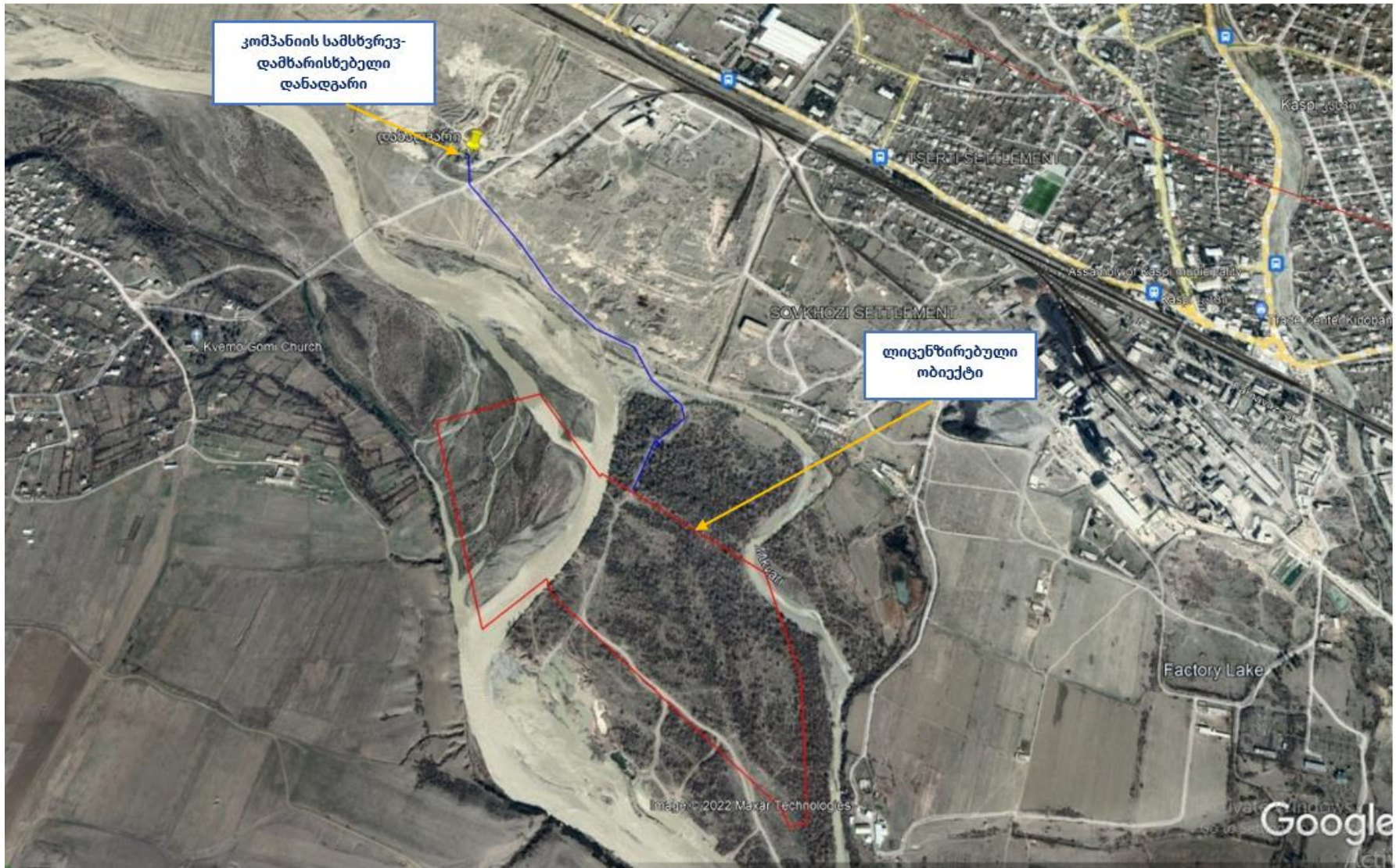
სურ. N2.2 - ლიცენზირებული ტერიტორია და კომპანიის საკუთრებაში არსებული სამსვრევ-დამხარისხებელი დანადგარი