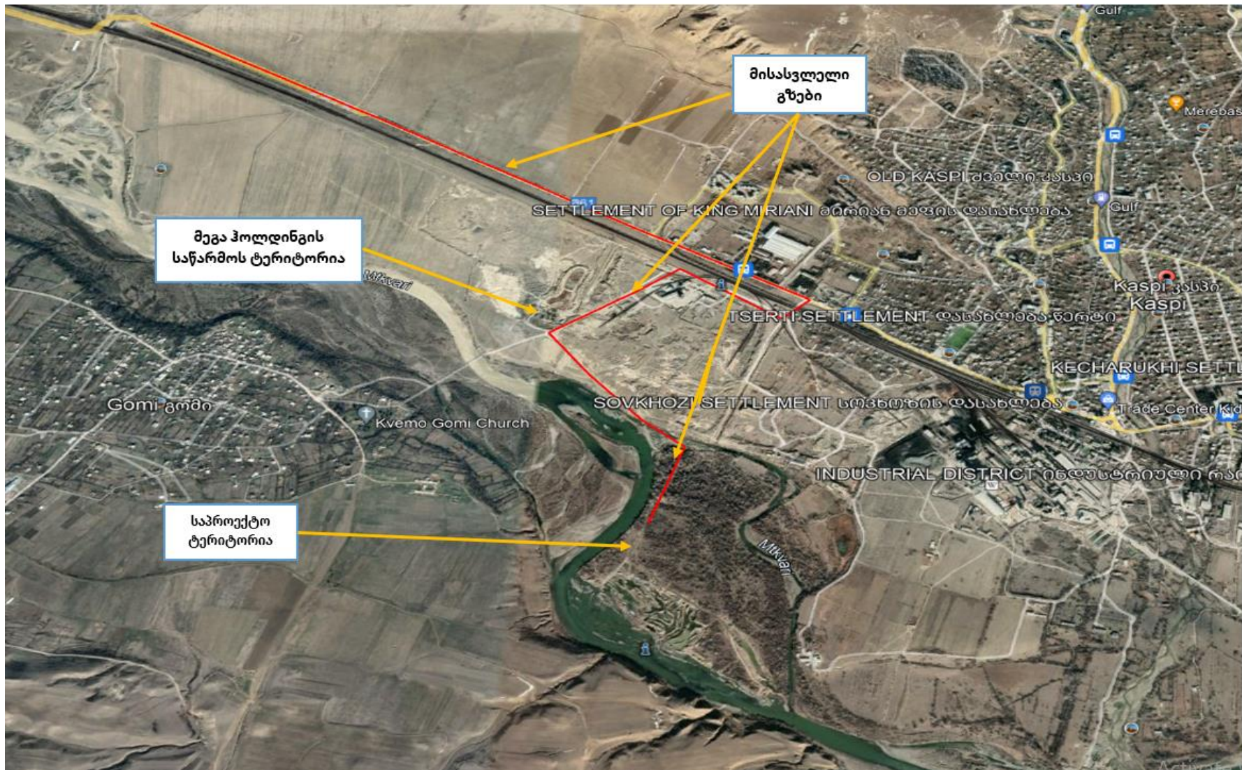
სურ. N 5.1 - ლიცენზირებული ობიექტიდან სამსხრვევ დამხარისხებულ დანადგარამდე და ასევე გადაუმუშავებელი ნედლეულის ტრანსპორტირებისთვის გამოსაყენებელი გზა