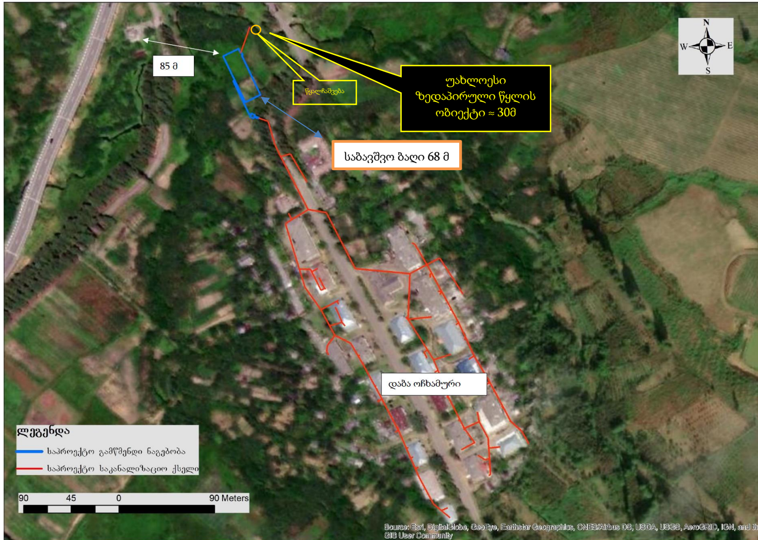
ნახაზი 2.2.1. საპროექტო არეალის სიტუაციური სქემა