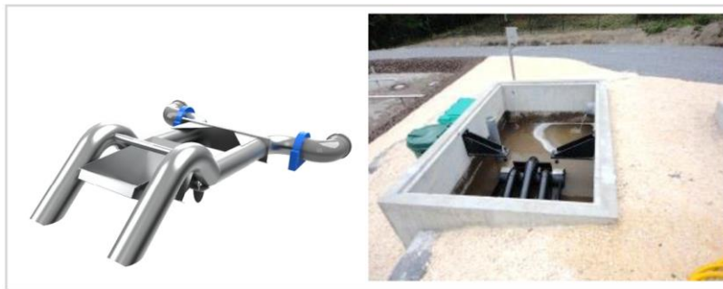
სურათი 2.3.5.1. ავტომატური რეგულირების სიფონი

სუნის გავრცელების შესამსუბუქებლად მიმღები და კვების სტრუქტურა იქნება დახურული ტიპის.