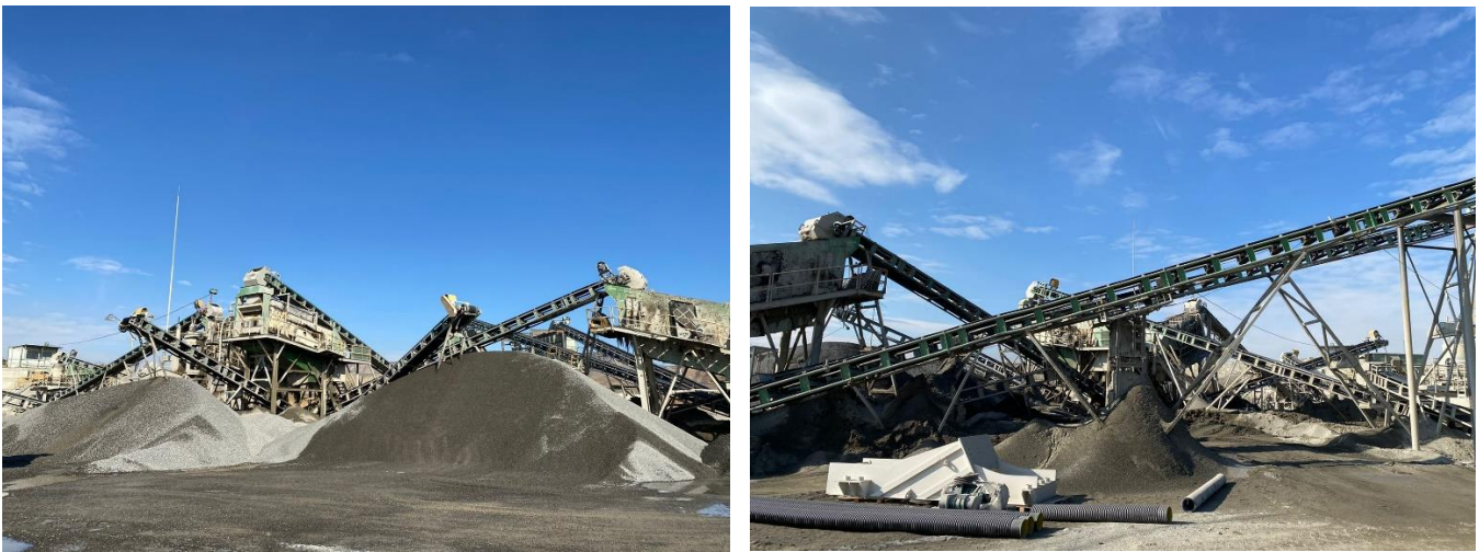
სურ. N2.1 - საპროექტო ტერიტორია

საპროექტო ტერიტორიამდე მიდის არსებული გზა, რომელიც უერთდება შიდასახელმწიფოებრივი მნიშვნელობის მაგისტრალს და დამაკმაყოფილებელ მდგომარეობაშია. შესაბამისად დამატებითი გზების მოწყობა საქმიანობის ფარგლებში გათვალისწინებული არ არის. აღსანიშნავია ის ფაქტი, რომ საპროექტო ტერიტორია შემოდობილია და მიწის ნაკვეთებამდე მიყვანილია ელექტრო ენერგია.