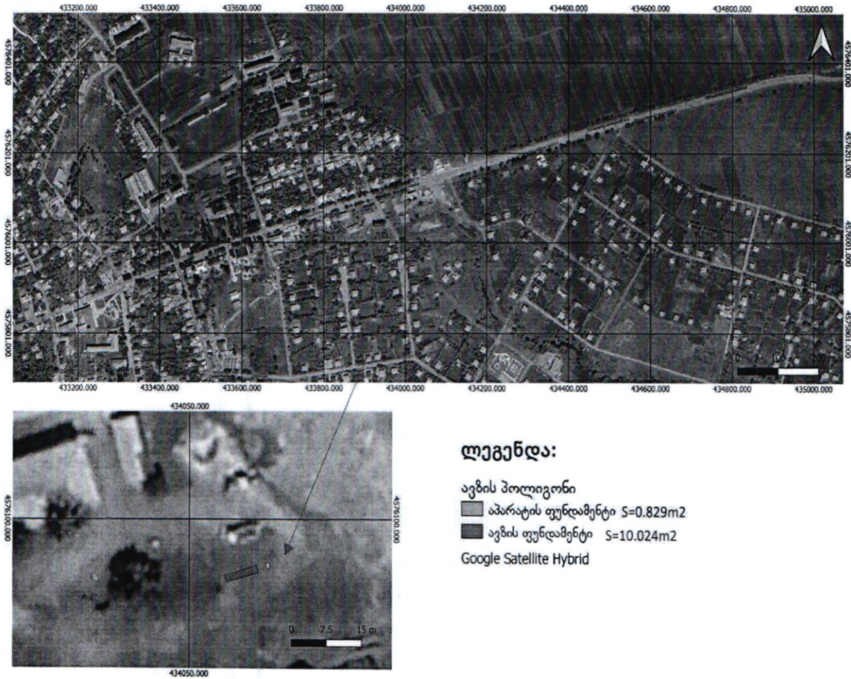
სურათი 2. ნავთობპროდუქტის განთავსების ტერიტორიის სიტუაციური სქემა

ნავთობპროდუქტის რეზერვუარი წარმოადგენს ცილინდრული ფორმის მიწისზედა დაწვენილ ჭურჭელს, რომელიც დამზადებულია ლითონისგან, კედლის სისქეა 10 მმ., დაფარულია მინიმუმ 80 მკრ სისქის ანტიკოროზიული ემალირებული საღებავით და აღჭურვილია სასუნთქი სარქველით. რეზერვუარზე დამონტაჟებული სასუნთქი სარქველის სიმაღლეა 3 მ., ხოლო დიამეტრი 0.05 მ. რეზერვუარს აქვს ლუქი და მასზე მიდუღებულია ლითონის კიბე ლუქთან არსებული მოედნით (განკუთვნილი რეზერვუარის ტექნიკური მომსახურებისთვის).