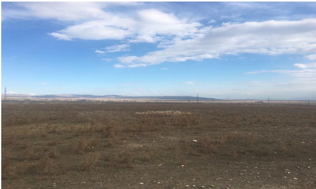
სურათი 4.4. მიწის მინაკუთვნი მე-4 უბანი