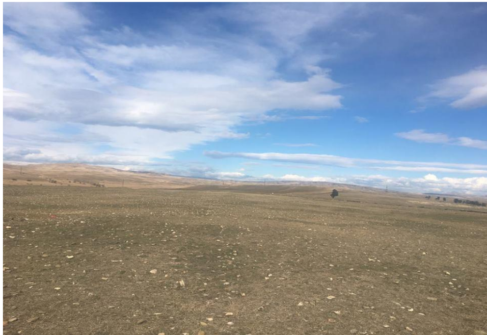
სურათი 4.1. მიწის მინაკუთვნის პირველი უბანი