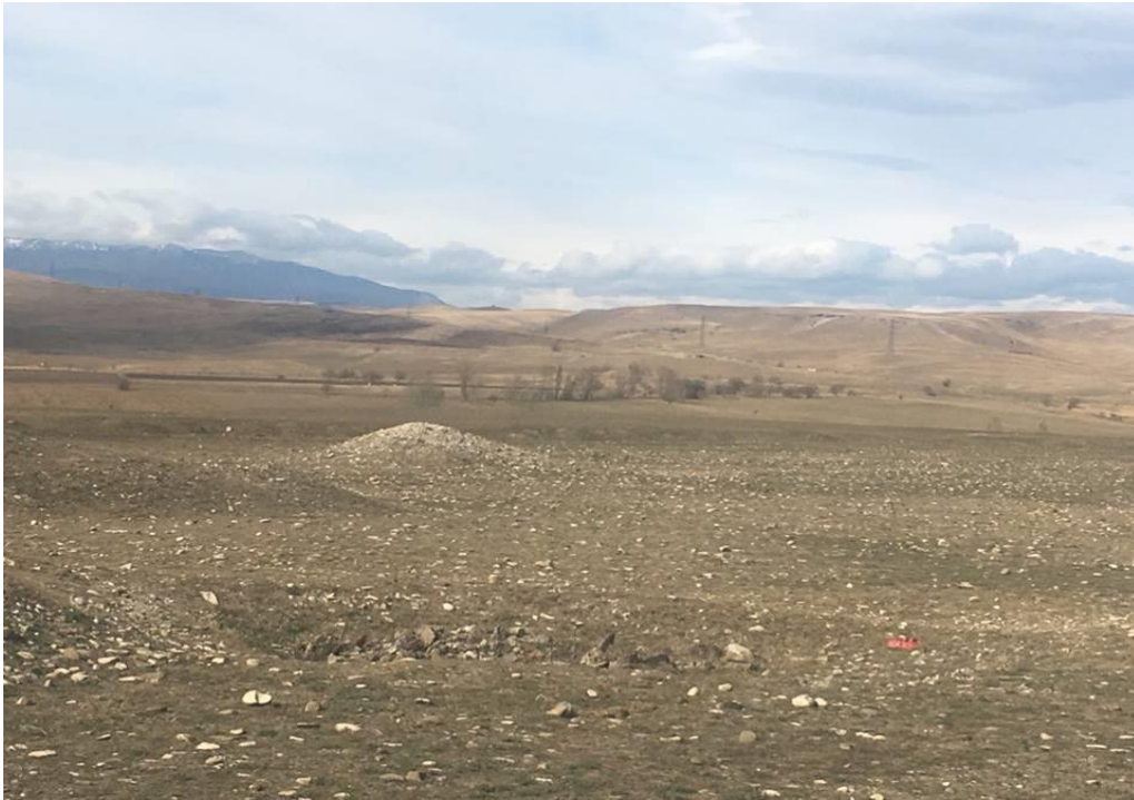
სურათი 4.3. მიწის მინაკუთვნი მე-3 უბანი