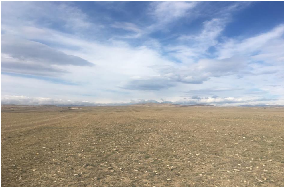
სურათი 4.2. მიწის მინაკუთვნის მე-2 უბანი