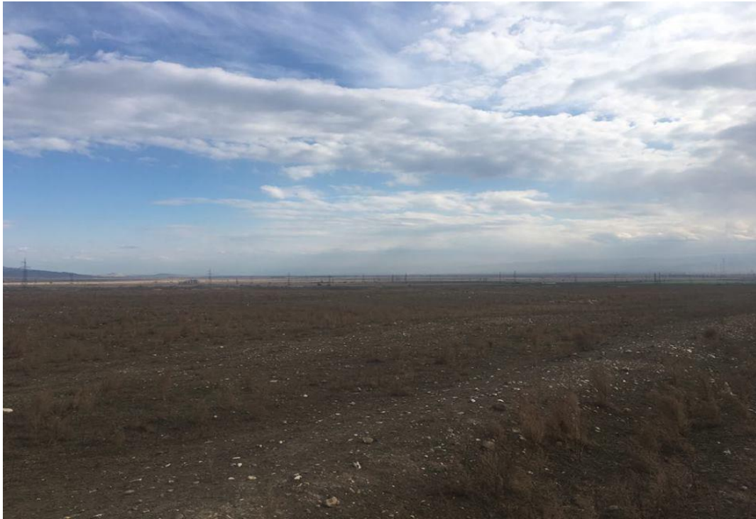
სურათი 4.5. მიწის მინაკუთვნი მე-5 უბანი