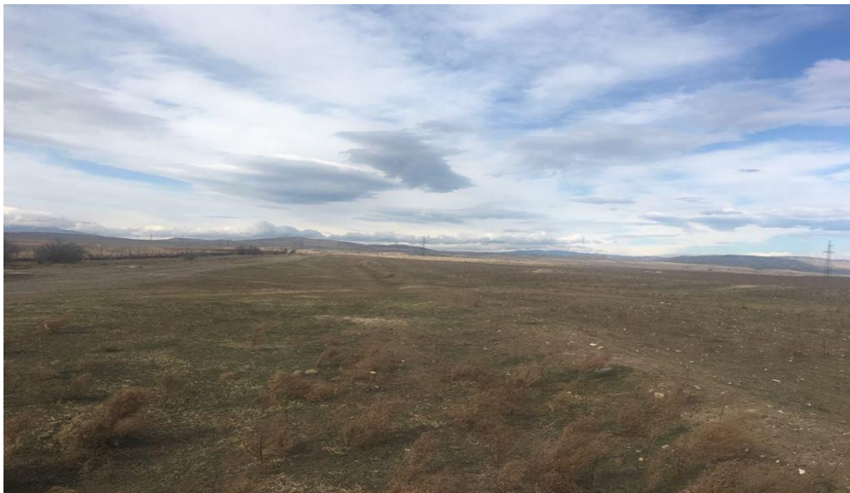
სურათი 4.6. მიწის მინაკუთვნი მე-6 უბანი