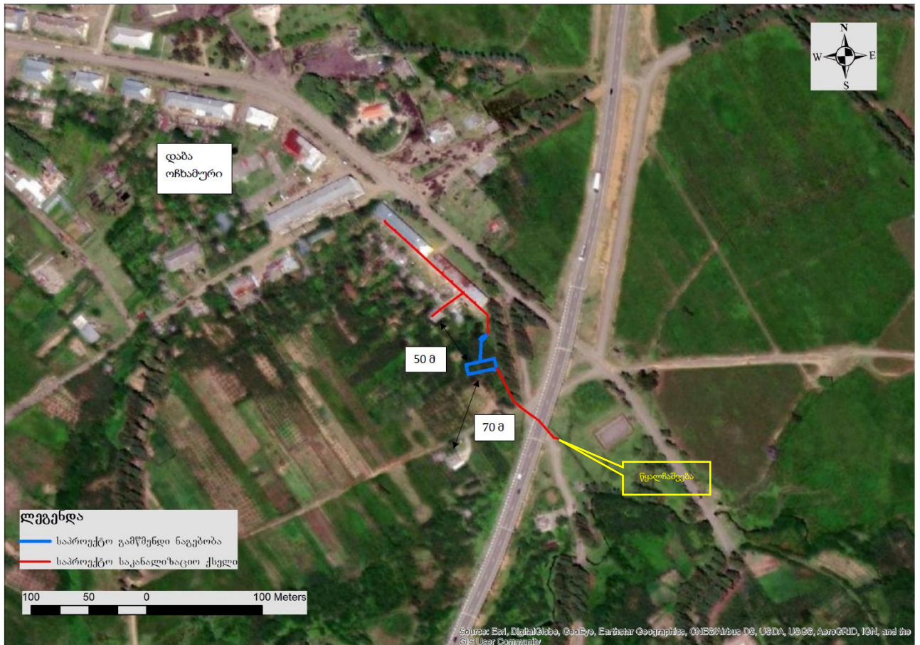
ნახაზი 2.1. დაბა ოჩხამურის №2 გამწმენდი ნაგებობის საპროექტო არეალის სიტუაციური სქემა