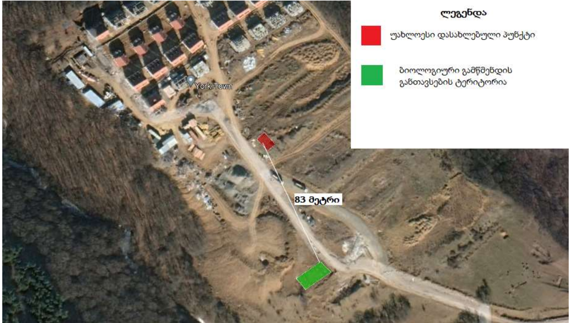
სქემა 2.1.1 უახლოესი დასახლებული პუნქტი გამწმენდი ნაგებობიდან