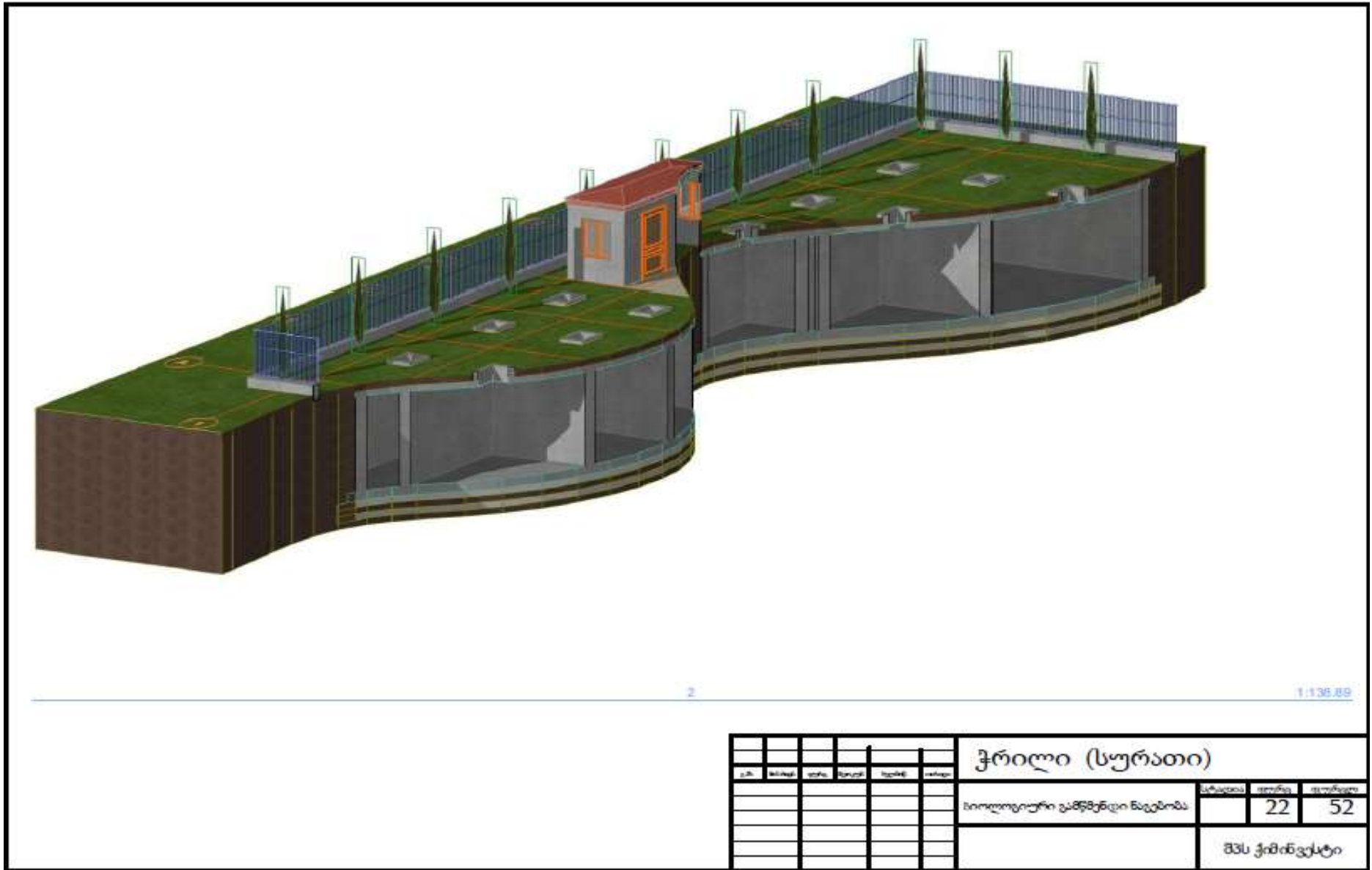
სურ. 2.2.3.1 ბიოლოგიური გამწმენდი ნაგებობის ზოგადი ჭრილი