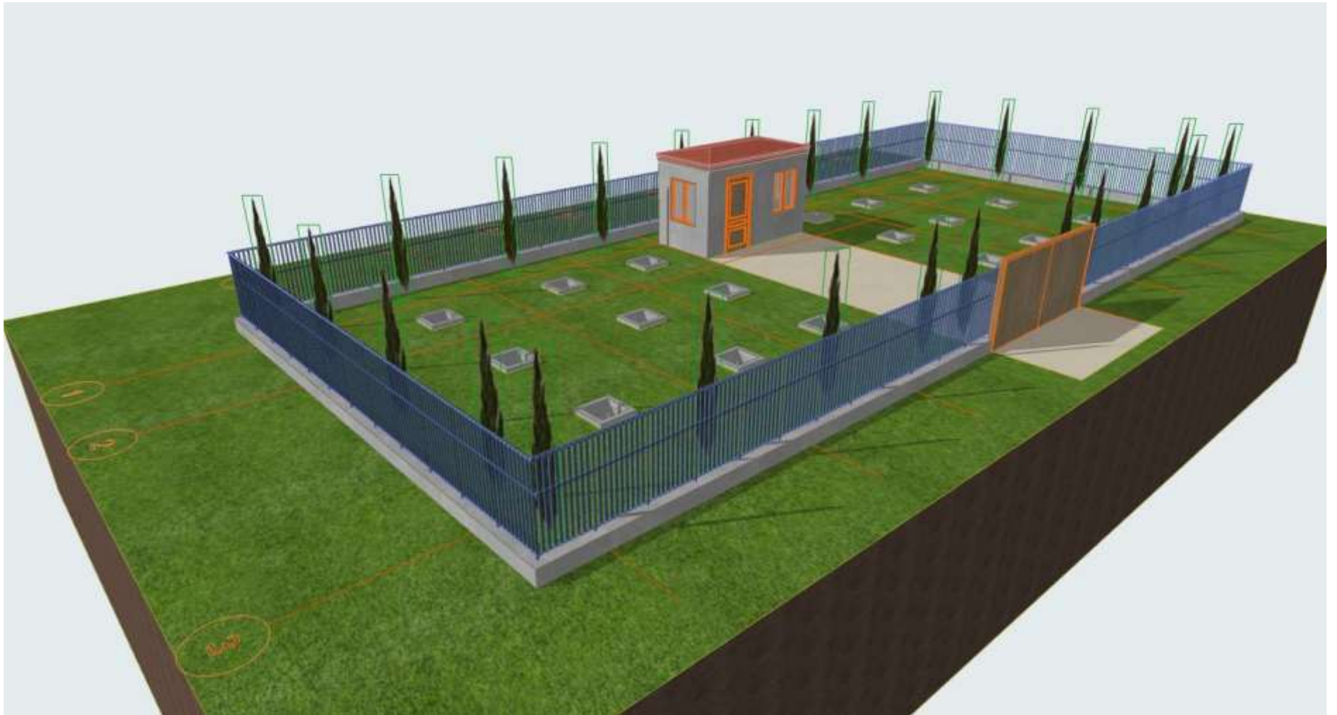
სურათი 1.1.1 გამწმენდი ნაგებობის განთავსების სქემა