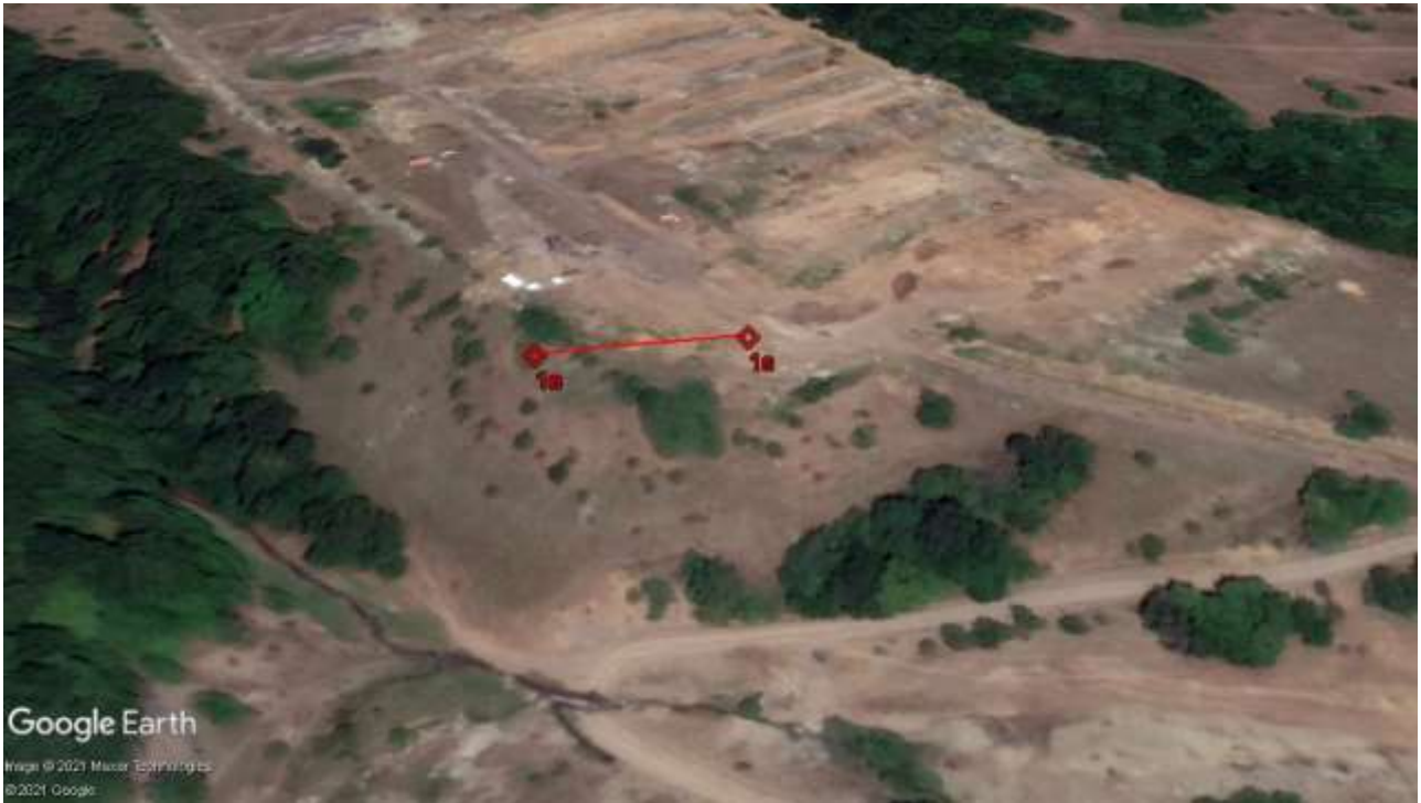
ცხრილი 3.4.1. სეისმური პროფილის დასაწყისი და საბოლოო კოორდინატები. #1.1 მიუთითებს პროფილის დასაწყისს, ხოლო #1.24 - პროფილის ბოლოს. H მიუთითებს აბსოლუტურ სიმაღლებს