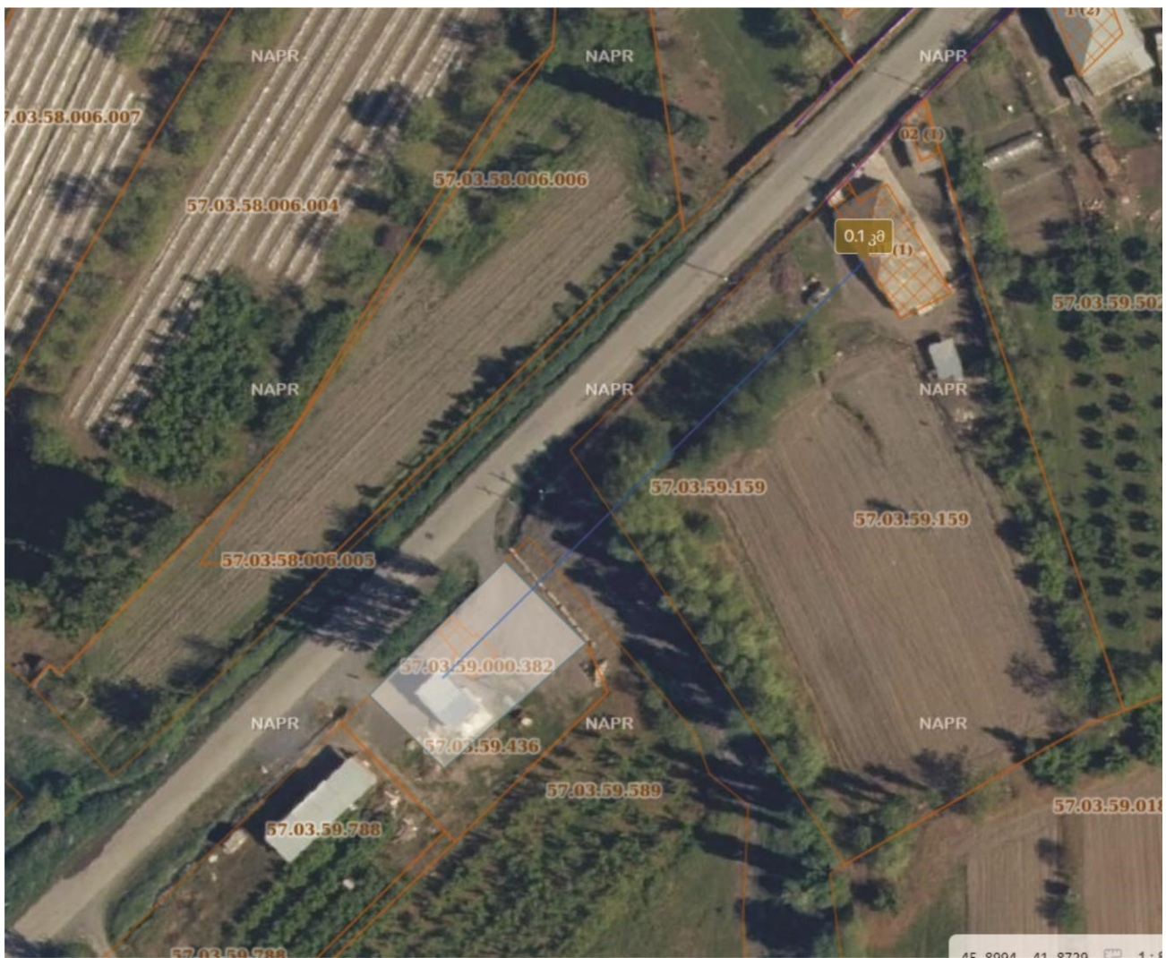
ნახაზი 1 ავტოგასამართი სადგურის გეგმა მ 1 : 300