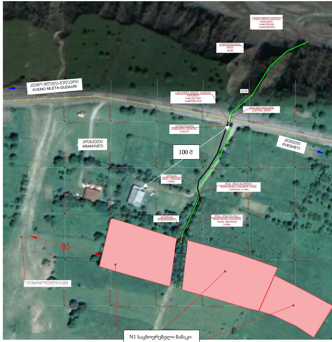
ნახაზი 2.1. საპროექტო ტერიტორიის სიტუაციური სქემა