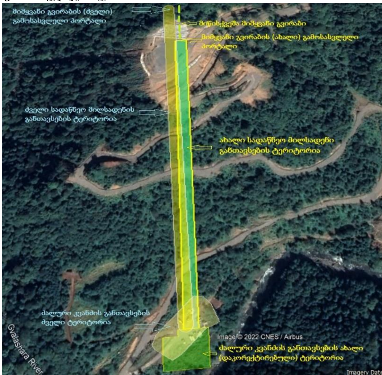
სურათი 2.1. ცვლილების სქემა

აღსანიშნავია, რომ ძალური კვანძის, სადაწნეო მილსადენის და გამოსასვლელი პორტალის ტერიტორიები წარმოადგენენ (შპს „ქართული საინვესტიციო ჯგუფი ენერჯია“) საქმიანობის განმახორციელებლის საკუთრებას, რომელიც დასტურდება ამონაწერებით.