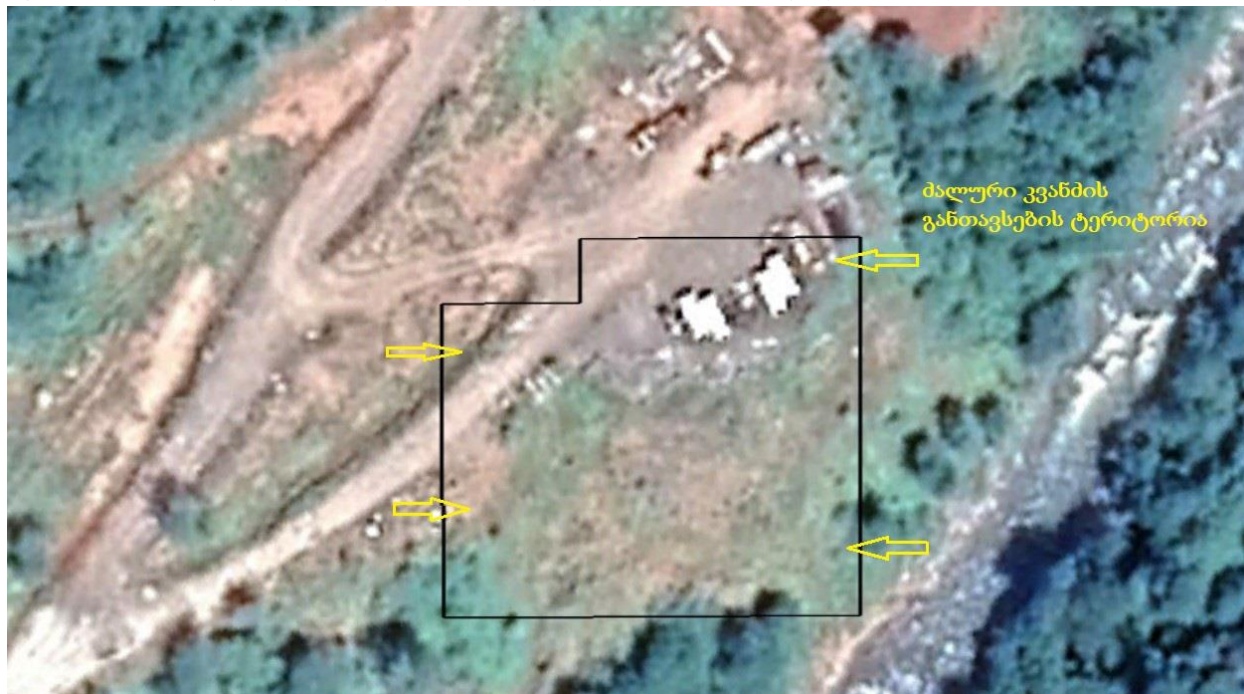
სურათი 3.5.1 ძალური კვანძის განთავსების ტერიტორიის ორთო ფოტო

ახალი განთავსების ტერიტორია არ საჭიროებს დამატებით მცენარეული საფარისგან გაწმენდას, შესაბამისად ზემოქმედება მცენარეულ საფარზე არ არის მოსალოდნელი.