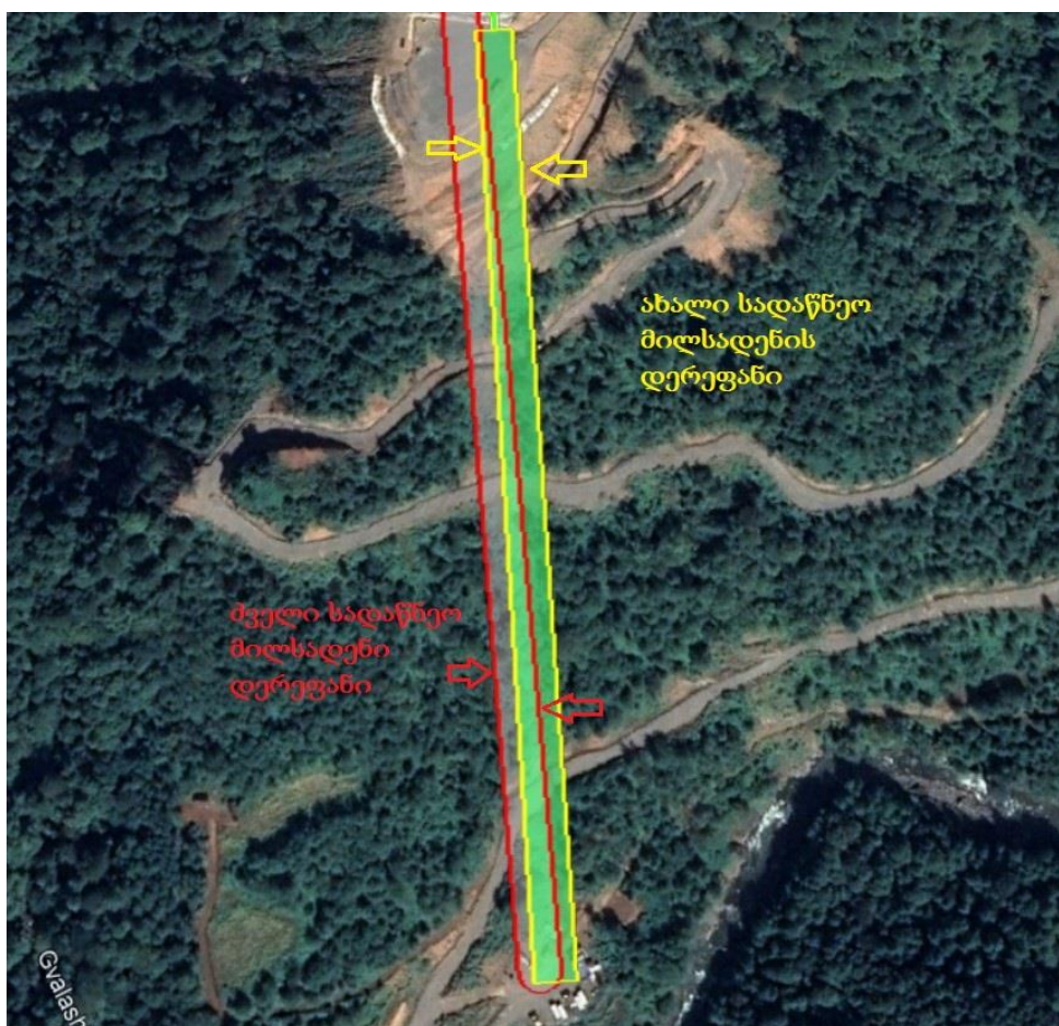
სურათი 3.5.2 ახალი და ძველი სადაწნეო მილსადენის განთავსების ორთო ფოტო

ახალი საპროექტო სადაწნეო მილსადენის ტერიტორია არ გამოირჩევა ფლორისტული მრავალფეროვნებით. აღსანიშნავია, ის გარემოება რომ ახალი სადაწნეო მილსადენის ფართობი ნაწილობრივ მოიცავს ძველი განთავსების ტერიტორიას, რომელზეც სსიპ „ეროვნული სატყეო სააგენტო“-სთან შეთანხმებით განხორციელებულია მცენარეული საფარისაგან გაწმენდის სამუშაოები. იმის გათვალისწინებით, რომ საპროექტო ტერიტორია წარმოადგენს შპს „ქართული საინვესტიციო ჯგუფი ენერჯის“ საკუთრებას, დამატებით ხე-მცენარეების ჭრის შემთხვევაში განხორციელდება შესაბამის უფლებამოსილ ორგანოსთან შეთანხმება. გამოწვეული ცვლილება, არ იწვევს წითელი ნუსხის სახეობებზე ზემოქმედებას.