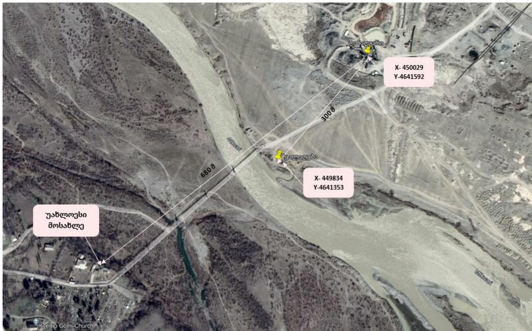
სურ. N2.2 - ობიექტის განთავსების სიტუაციური რუკა