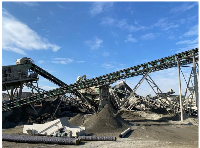
სურ. N2.1 - საპროექტო ტერიტორია