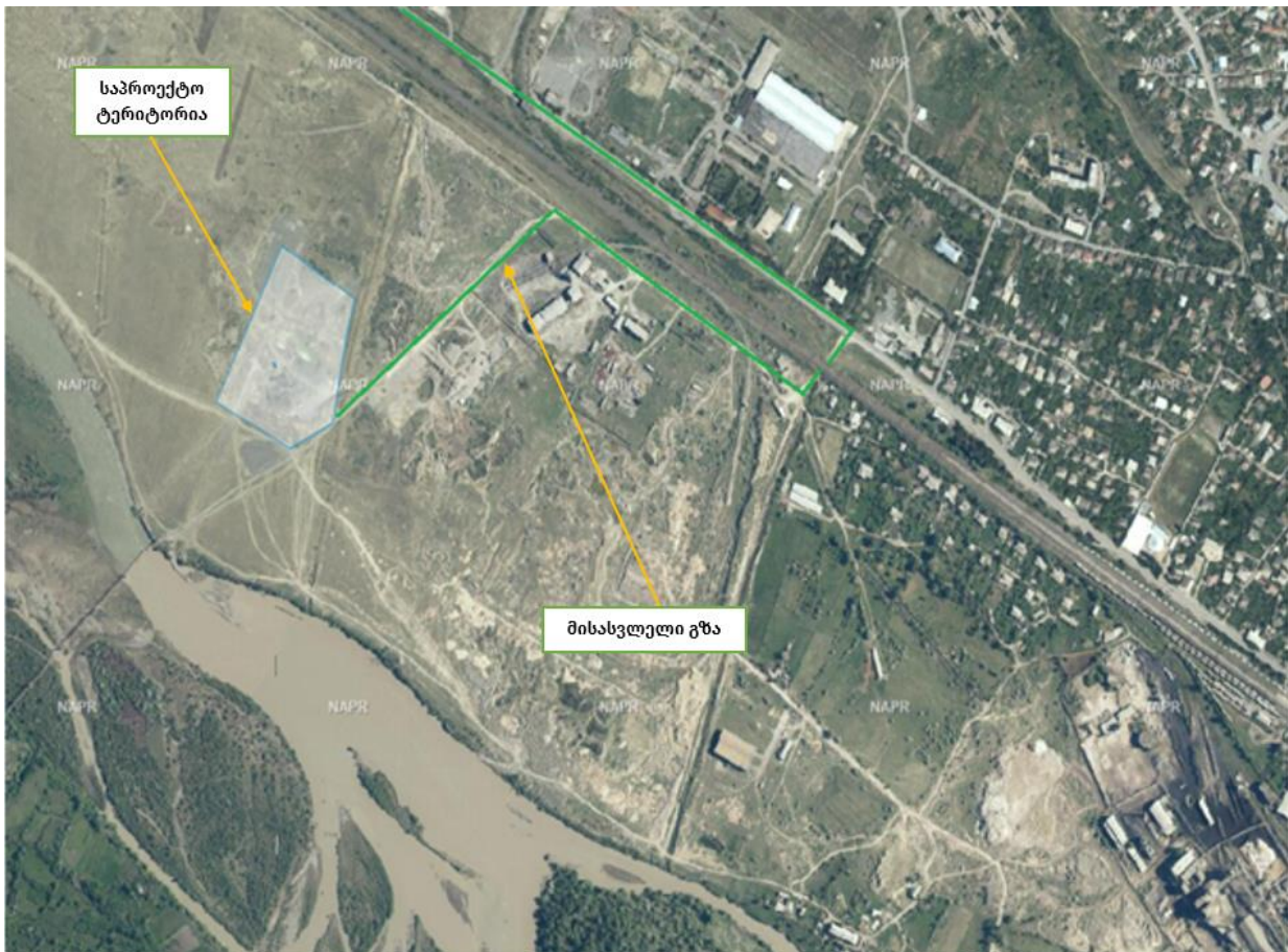
სურ. N6.1 - მისასვლელი გზა

საწარმოს ტერიტორიამდე, ქ. კასპიდან, კერძოდ კი იგოეთი-კასპი-ახალქალაქის შიდასახელმწიფოებრივი მნიშვნელობის გზიდან (შ61) შემოდის ნაწილობრივ ასფალტირებული და ნაწილობრივ მოხრეპილი სასოფლო გზა, რომელიც დამაკმაყოფილებელ მდგომარეობაშია და არ საჭიროებს დამატებით სარემონტო სამუშაოებს.