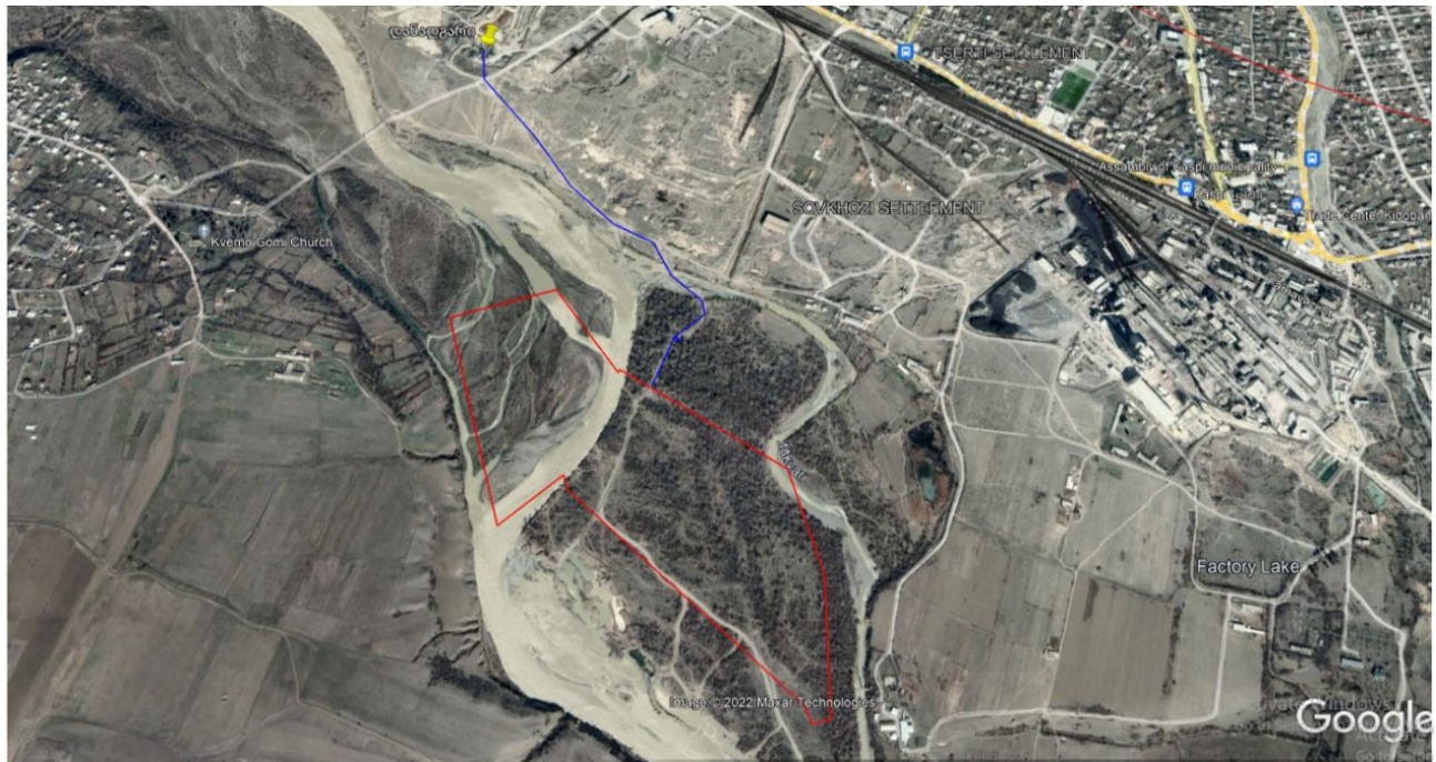
სურ. N3.3 - მარშრუტი საწარმოო დანადგარიდან დაგეგმილ კარიერამდე