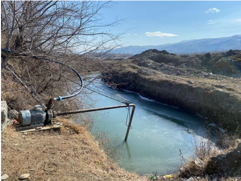
სურ. N5.2 - წყალადების წერტილი