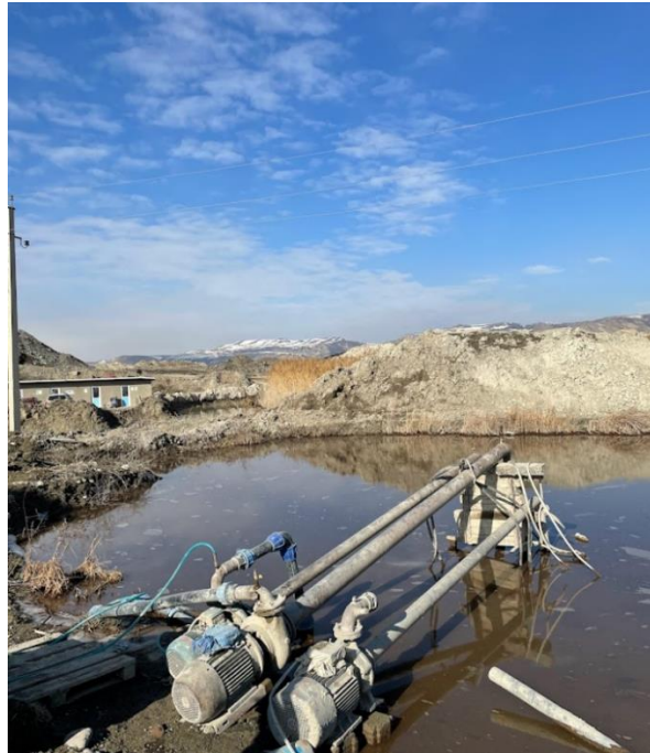
სურ N5.4 - წყლის მიმღები ბასეინი და მასში განთავსებული ტუმბოები

რაც შეეხება საწარმოს ტერიტორიაზე წარმოქმნილ სანიაღვრე წყლებს, აღნიშნული წყლები გადის გრუნტში , რადგან საწარმოში არ მიმდინარეობს ისეთი საქმიანობა, რაც იწვევს მათ პოტენციურ დაბინძურებას. აღსანიშნავია, რომ სანიაღვრე წყლების დაბინძურების პოტენციურ წყაროდ შესაძლოა განხილული იყოს საწვავის რეზერვუარები, თუმცა როგორც აღინიშნა, რეზერვუარებთან მოწყობილია შესაბამისი მიწისქვეშა ბეტონის ორმო, სადაც გროვდება დაღვრილი საწვავი, რომელიც დაგროვების შესაბამისად, შესაბამისი მართვის მიზნით გადაეცემა სათანადო ნებართვის მქონე კომპანიას. ამასთან, გათვალისწინებულია საწვავგასამართი სვეტის გადახურვა, რათა სანიაღვრე წყლების მოხვედრა მის ტერიტორიაზე არ მოხდეს.