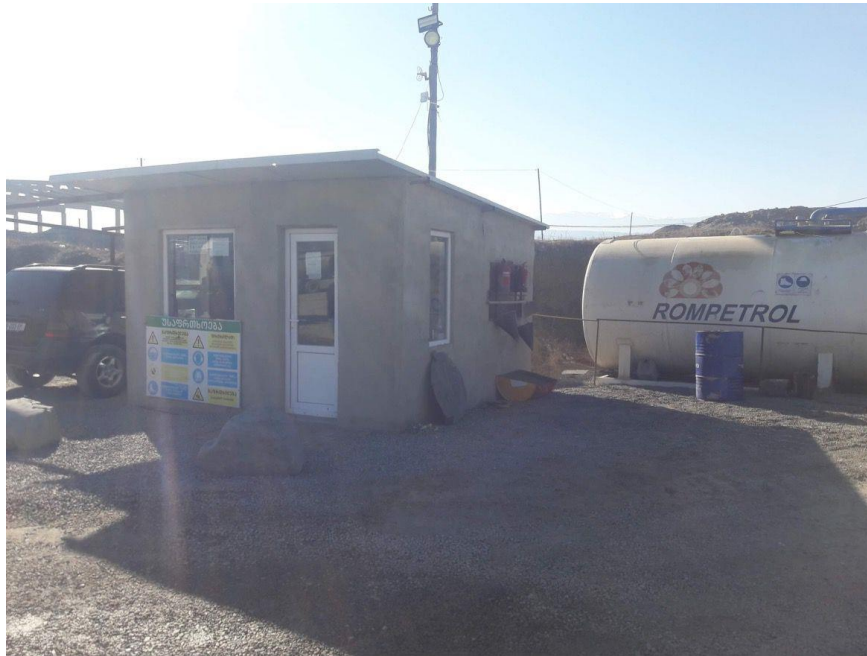
სურ. N3.2 - ადმინისტრაციული შენობა და საწვავის რეზერვუარი

საწარმოში სასარგებლო წიაღისეულის შემოტანა ამ ეტაპზე ხორციელდება შპს „მეგა ჰოლდინგის“ სხვადასხვა ლიცენზირებული კარიერიდან. აღნიშნული კარიერები მდარეობს კასპის ტერიტორიაზე. აღსანიშნავია, რომ კომპანიამ ახლახანს აიღო კიდევ ერთი, ახალი სასარგებლო წიაღისეულის მოპოვების ლიცენზია, კერძოდ კი ქვიშა ხრემის მოპოვებაზე (სასარგებლო წიაღისეულის მოპოვებაზე სამინისტროში წარმოდგენილია შესაბამისი სკოპინგის ანგარიში). აღნიშნული სალიცენზიო ობიექტი გადამამუშავებელი დანადგარიდან დაცილებულია დაახლოებით 741 მეტრით. შესაბამისად, ახალი ლიცენზირებული ობიექტიდან სასარგებლო წიაღისეულის მოპოვებასთან დაკავშირებულ, კანონით გათვალისწინებული პროცედურების გავლის შემდგომ, კომპანია წარმოებისთვის საჭირო ნედლეულს ძირითადად შემოიტანს აღნიშნული კარიერიდან. აღსანიშნავია, რომ ასეთ შემთხვევაში, ნედლეულით დატვირთულ თვითმცლელებს არ მოუწევთ ქალაქში არსებული გზების გამოყენება და დასახლებულ პუნქტთან გავლა, რაც შეამცირებს სატრანსპორტო ნაკადებსა და მოსახლეობაზე გამოწვეულ შესაძლო ზემოქმედებას (სურ. N3.3-ზე წარმოდგენილია მარშრუტი საწარმოო დანადგარიდან დაგეგმილ კარიერამდე). საწარმოში ინერტული მასალების დამუშავების სრული ციკლი მიმდინარეობს სველი მეთოდით, რის გამოც დანადგარის ფუნქციონირებისას არ ხდება მტვრის წარმოქმნა და მისი გავრცელება ატმოსფერულ ჰაერში. ამასთან, საწარმო მთლიანად მუშაობს ელექტროენერჯის გამოყენებით, რითაც საწარმო მარაგდება ტერიტორიაზე არსებული ტრანსფორმატორიდან.