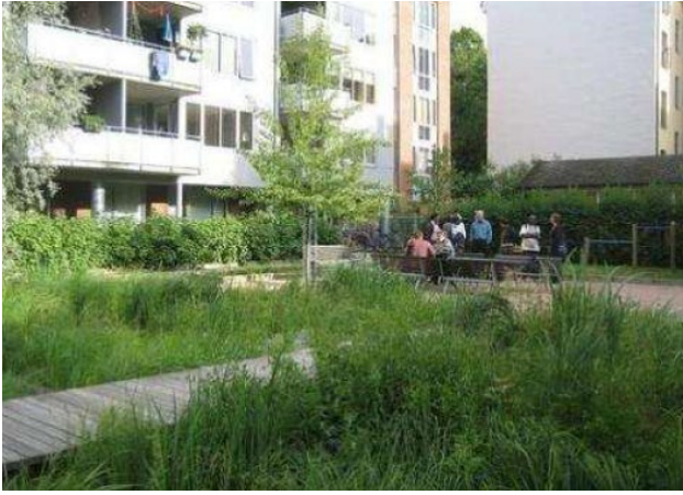
ე.წ. „აშენებული ჭაობების“ ტიპის გამწმენდი ნორვეგიის ურბანულ ზონაში