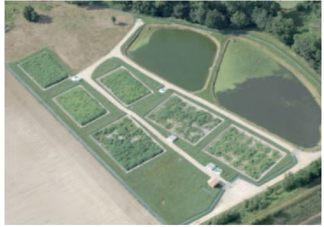
ე.წ. „აშენებული ჭაობების“ ტიპის გამწმენდი საფრანგეთის ქალაქ სენტ-ეტიენის მიმდებარედ