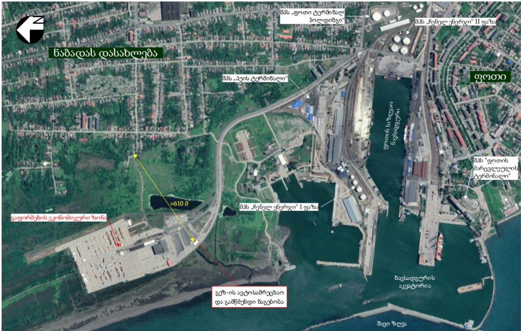
სურათი 2.1. ფოთის საზღვაო ნავსადგურის განთავსების ტერიტორიის სიტუაციური სქემა