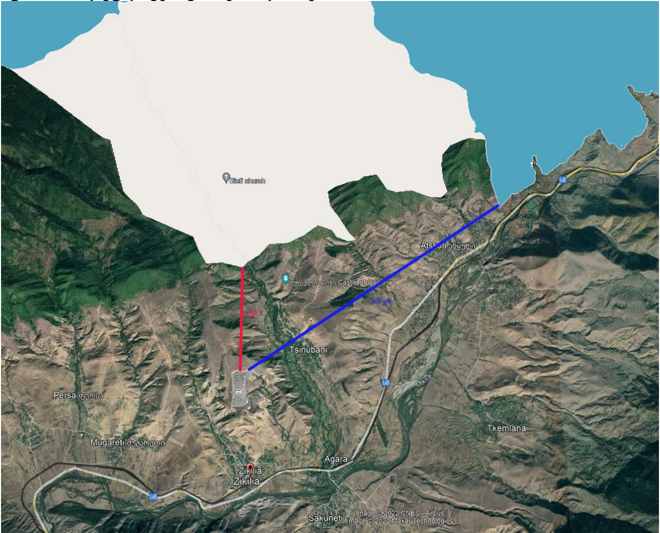
სურათი 4 - დაცული ტერიტორიების დაშორება

დაცულ ტერიტორიებზე ზემოქმედებას ადგილი არ ექნება, ვიანაიდან არსებული ქვესადგურის მიმდებარედ 2კმ დაშორებით იწყება ზურმუხტის ქსელი (ბორჯომ-ხარაგაული 2 GE0000056. სურათზე თეთრი ფერით), ხოლო 5,5 კმ-ში იწყება ბორჯომ-ხარაგაულის ეროვნული პარკის საზღვარი, სურათზე მოცემულია ლურჯი ფერით (იხ. სურათი 4). ყოველივე აღნიშნულისა და დაგეგმილი გაფართოების სამუშაოების ხასიათის გათვალისწინებით, დაცულ ტერიტორიებზე ზემოქმედებას ადგილი არ ექნება.