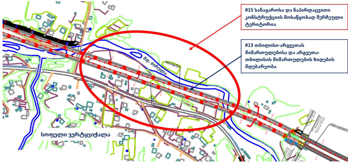
ნახაზი 3: შერჩეული ტერიტორიის სქემატური ვიზუალიზაცია