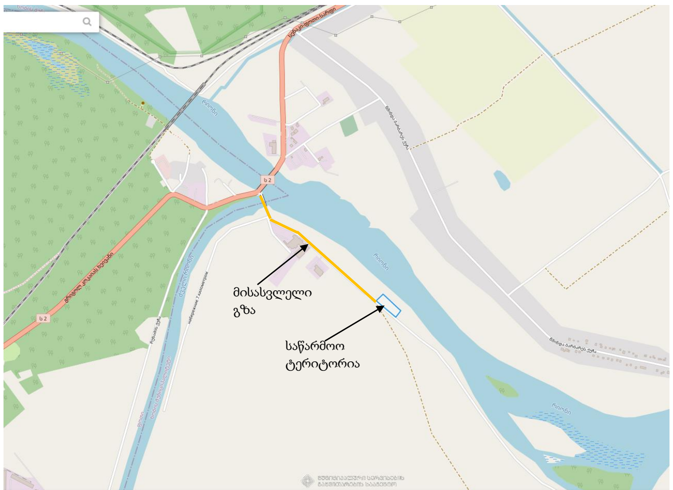
სურათი 6.9.1. სატრანსპორტო ნაკადის მოძრაობის სქემა.

საწარმოო ტერიტორიიდან ცენტრალური საავტომობილო გზიდან „სენაკი-ფოთი-სარფი“ მისასვლელი შიდა გზა დაშორებულია 1150 მეტრში მანძილით. ობიექტიდან ინერტული მასალების (ქვიშის) გასატანად გამოყენებული იქნება როგორც ცენტრალური საავტომობილო გზა და მისგან შემომავალი 1150 მეტრის სიგრძის საავტომობილო გზა. აქვე უნდა აღვნიშნოთ ქვიშის გატანა არ ხდება კერძო საკუთრებში არსებული მიწის ნაკვეთების გამოყენება გზებისთვის. ასევე აღნიშნული მარშრუტი არ გადის დასახლებულ პუნქტებზე, შესაბამისად, მოსახლეობის შეწუხება - ფიზიკური ან ეკონომიკური განსახლების რისკი მოსალოდნელი არ არის.